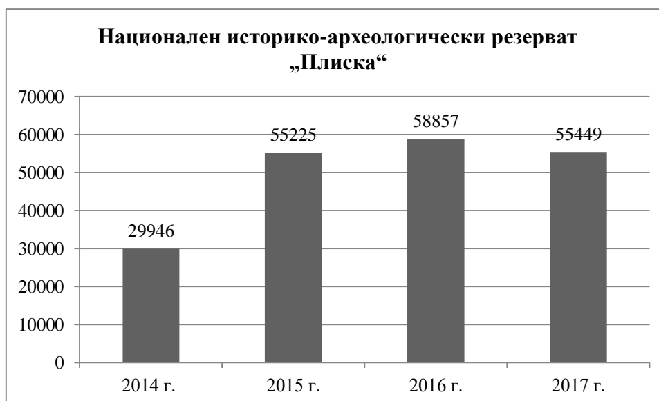
Фиг. 2. Брой посетители в ИАР „Плиска“ за периода 2014 – 2017 г. (по оперативни данни на РИМ – Шумен)