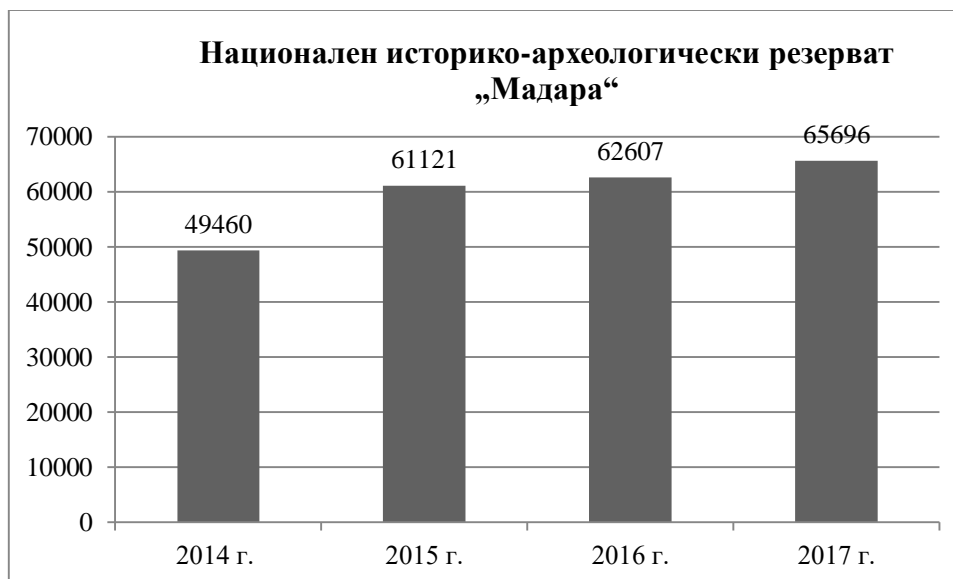
Фиг. 1. Брой посетители в НИАР „Мадара“ за периода 2014 – 2017 г. (по оперативни данни на РИМ – Шумен)

„Мадара“ – 238 884 д., следван от НИАР „Плиска“ с 199 477 д. докато другите обекти в дестинацията: Комплекс „Създатели на българската държава“ (79 925 д.), ИАР „Шуменска крепост (58 505 д.) и Регионален исторически музей – Шумен (43 425 д.) посрещат общо 181 855 д. (Фиг. 1,2,3,4,5).