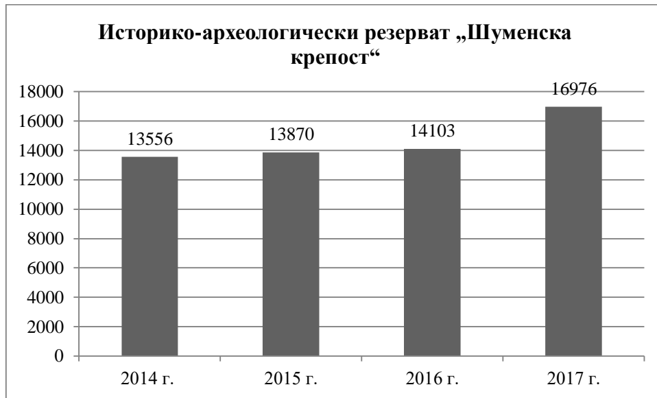
Фиг. 3. Брой посетители в ИАР „Шуменска крепост“ за периода 2014 – 2017 г. (по оперативни данни на РИМ – Шумен)